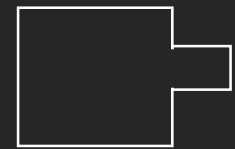
MEDIO / SUPERIOR